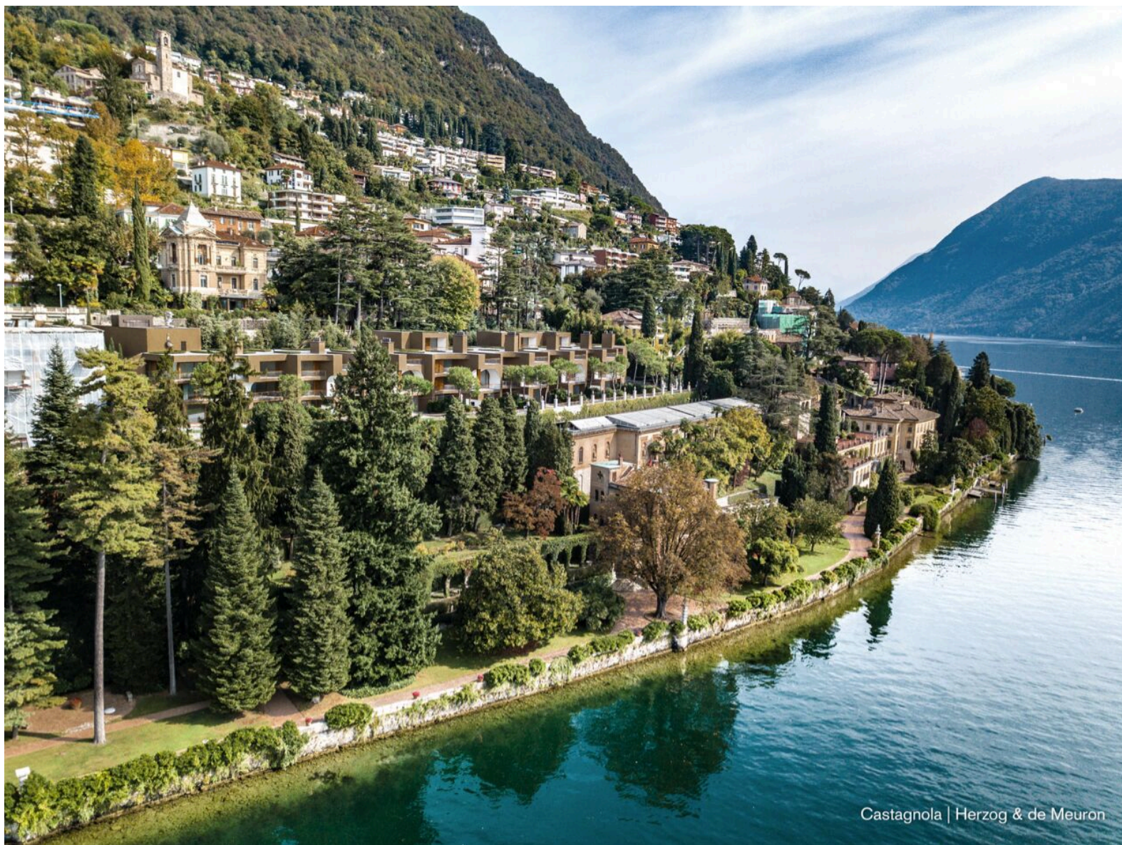
Castagnola | Herzog & de Meuron