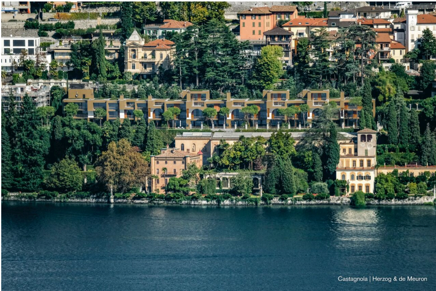
Castagnola | Herzog & de Meuron