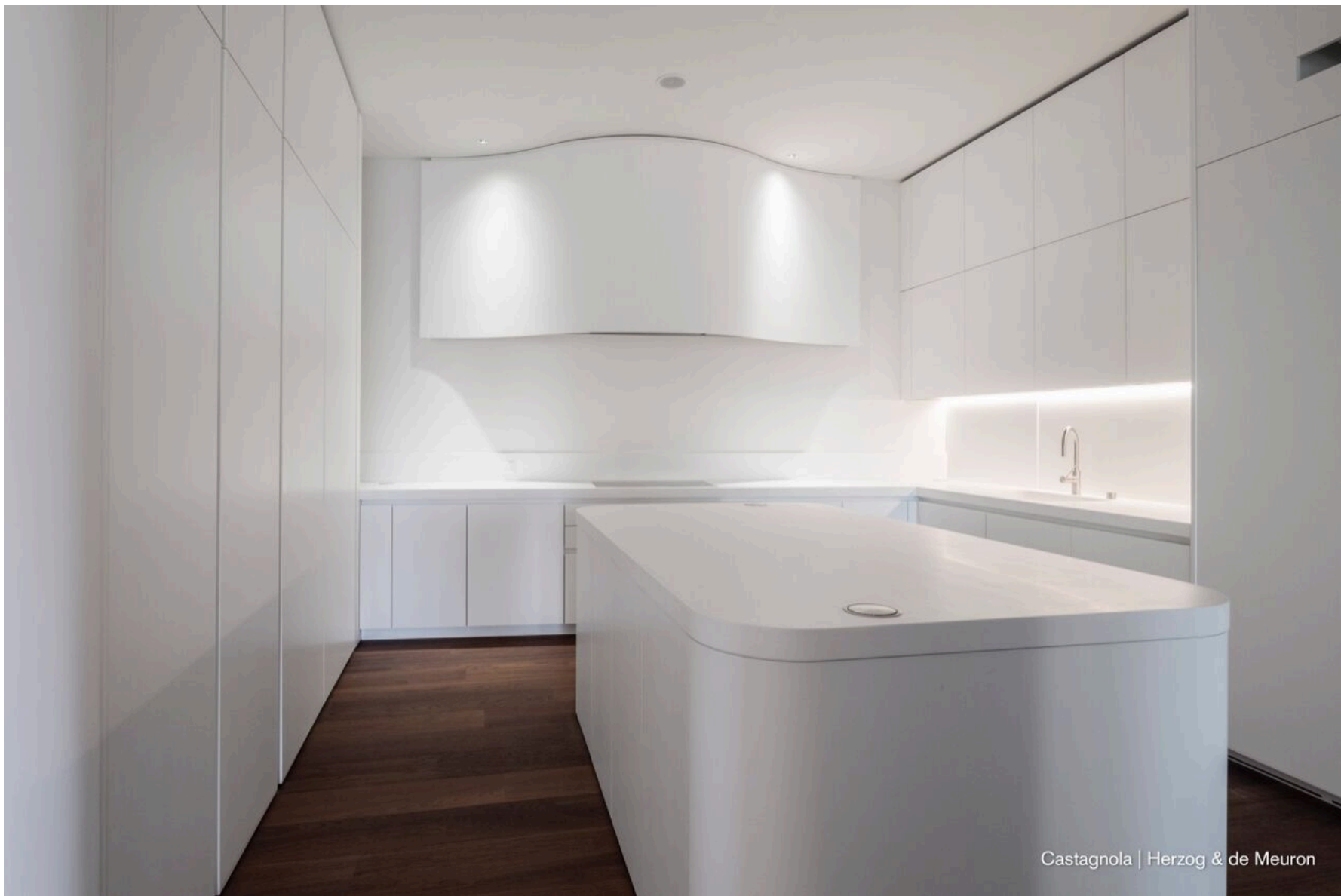
Castagnola | Herzog & de Meuron