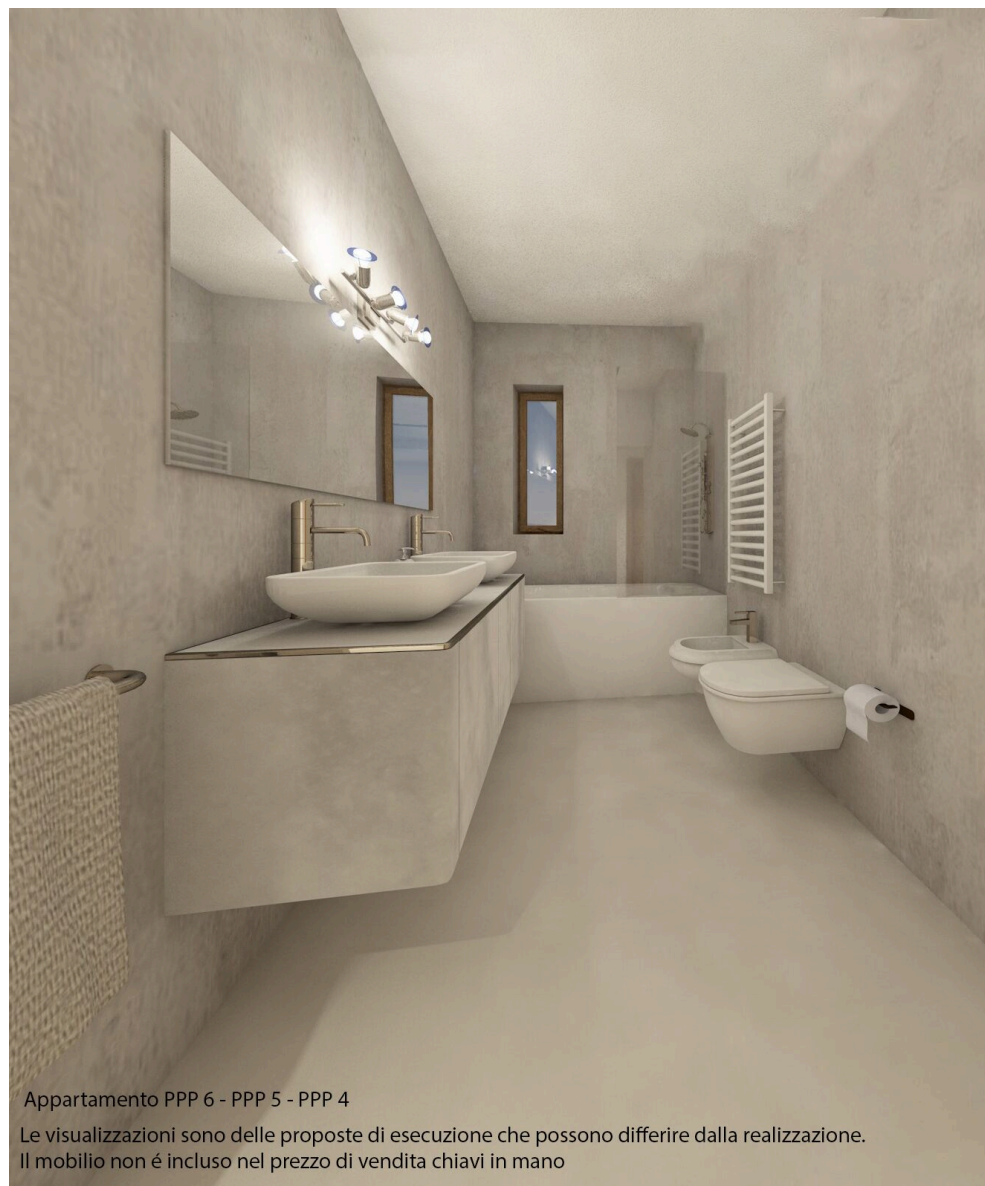
Appartamento PPP 6 - PPP 5 - PPP 4

Le visualizzazioni sono delle proposte di esecuzione che possono differire dalla realizzazione. Il mobilio non é incluso nel prezzo di vendita chiavi in mano