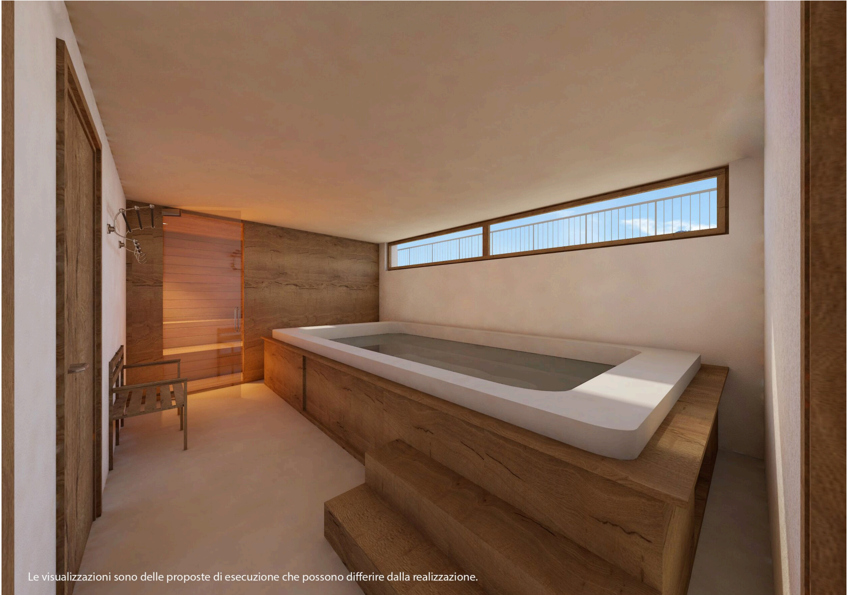
Le visualizzazioni sono delle proposte di esecuzione che possono differire dalla realizzazione.