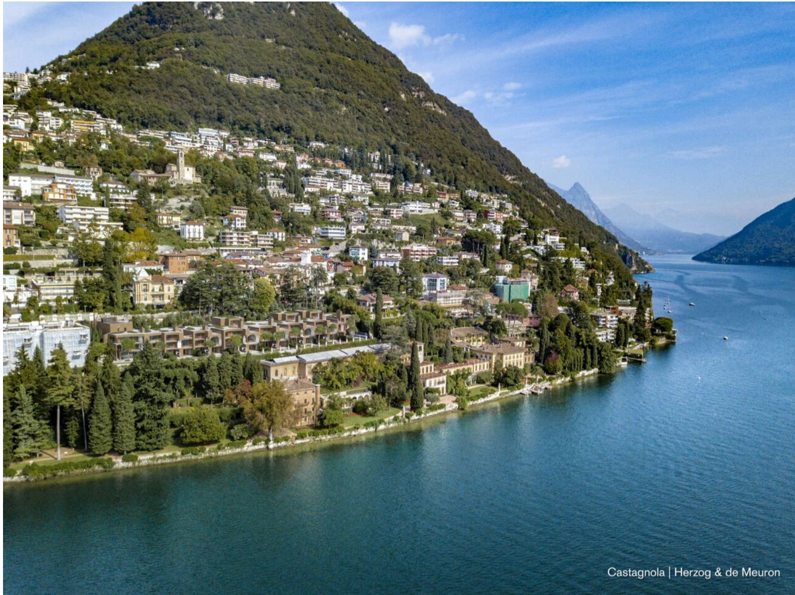
Castagnola | Herzog & de Meuron